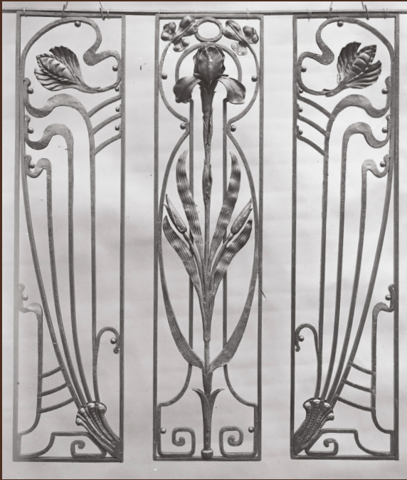
| Photographie des grilles en fer forgé, prise au début XX e siècle