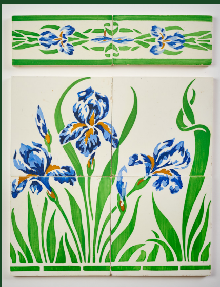
Frise murale, réalisés en faïence fine par Villeroy & Boch, Septfontaines-lez-Luxembourg, vers 1900 – Collection G. Freimann, Luxembourg