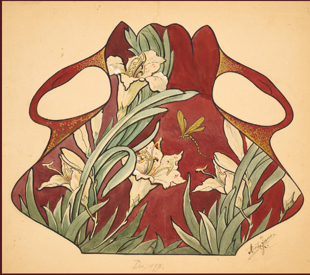
I Idée décorative, dessinée par Antoine Jans, après 1895 - MNAHA, don A. Wiltgen