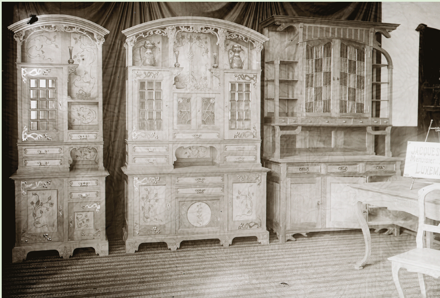
| Photographie d'une exposition de meubles de Jacques Lentz, prise au début du XX e siècle

La modernisation d'une habitation peut également s'effectuer par l'acquisition d'objets Art nouveau, que ce soit au Luxembourg ou à l'étranger. Les poêles en fonte ornés de motifs Art nouveau sont largement répandus. Dans des établissements comme les Grands Magasins Sternberg Frères fondés en 1909, on achète des vases en verre à la mode tels que ceux des frères Daum – présentés aussi lors de l'exposition de 1921 – ou réalisés dans le style d'Émile Gallé (1846-1904), autre figure de l'École de Nancy.