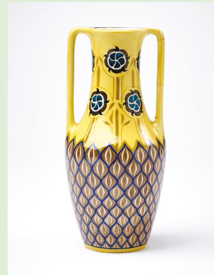
| Vase, conçu et peint par Antoine Jans, faïence fine, après 1895 – Collection famille Jans