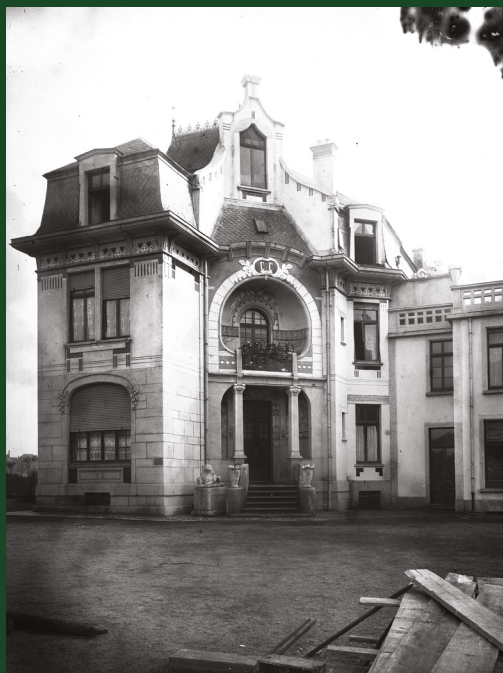
| Photographie de la villa Clivio, prise par l'architecte Mathias Martin en 1903 – Collection J.-P. Martin