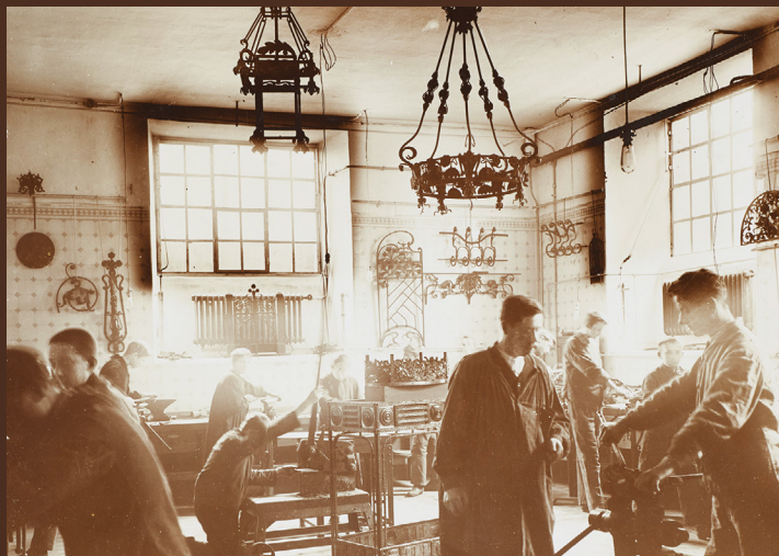
| Photographie de l'atelier de ferronnerie d'art à l'École d'Artisans, vers 1900