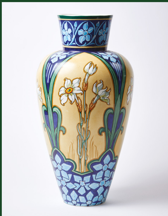
Vase, conçu et peint par Antoine Jans, réalisé en faïence fine par Villeroy & Boch, Septfontaines-lez-Luxembourg, après 1895 – MNAHA, don famille Origer