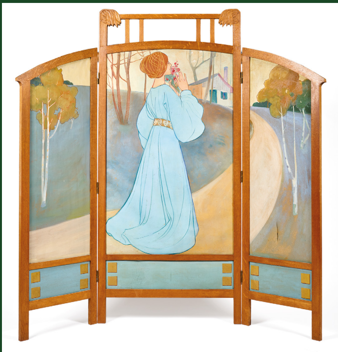
Paravent Art nouveau, conçu et réalisé par Dominique et Pierre Lang, huile sur toile et chêne, vers 1900 – Collection privée