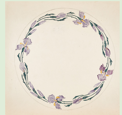
| Idée décorative, dessinée par Antoine Jans, après 1885 – MNAHA, don famille Origer