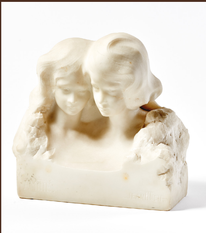
| Amitié, sculpture en marbre de Jean Mich, vers 1900 – MNAHA