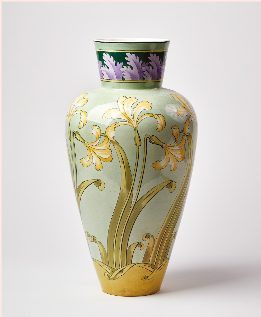
| Vase, conçu par Pierre Blanc, peint par Antoine Jans et réalisé en faïence fine par Villeroy & Boch, Septfontaines-lez-Luxembourg, après 1895 – MNAHA

Parallèlement, beaucoup d'artistes importent au Luxembourg des concepts créatifs provenant de l'étranger, soit par le biais d'œuvres individuelles, soit par l'enseignement de fondements théoriques ayant des répercussions à plus long terme. Mais la diffusion de l'Art nouveau dépend largement des commanditaires et des acquéreurs, ainsi que de leurs attentes. Cette situation a entraîné la coexistence de courants stylistiques variés, phénomène également constaté dans les pays voisins.